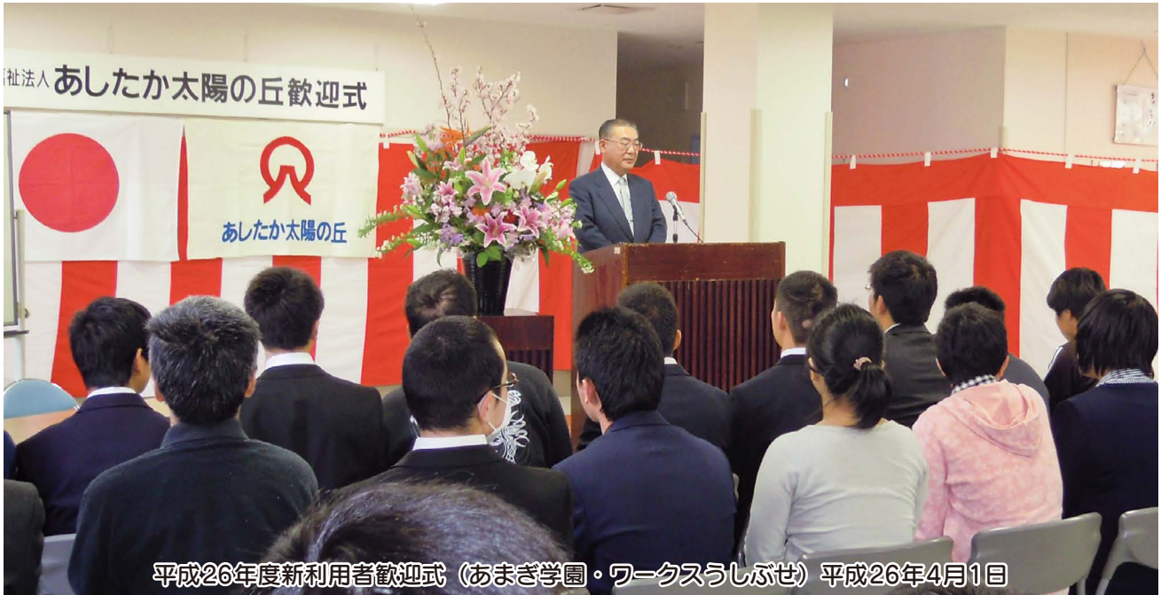
平成26年度新利用者歓迎式 (あまぎ学園・ワークスうしぶせ) 平成26年4月1日

障害者支援施設/あまぎ学園・ワークスうしぶせ・かぬぎ学園・ワークスとおがさ・静岡県立富士見学園 障害福祉サービス事業所/クリエート太陽 共同生活援助事業/コムユート浮島、フレンズ柴田・西井出・井上1,2・岡宮・下香貴・宮本、ファミーコ西椎路・ふたせがわ・原・まつなが・さくら・なおよ・宮本・原田地、サンライズ宮本・西椎路・まつなが 相談支援/総合地域サポートセンターひまわり 障害者就業・生活支援事業/障害者就業・生活支援センターひまわり 地域生活定着支援事業/静岡県地域生活定着支援センターひまわり 沼津市障害者相談支援事業/生活支援センターあしたか 公益事業/研修センター