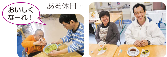
手作りおやつで贅沢なティータイム♡