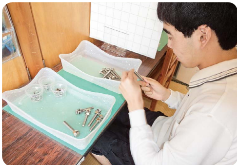
机上課題「ボルト組立作業」

今年度「生活介護活動班」では、机上課題、音楽活動、学習、サーキットトレーニングといった新たなプログラムを取り入れて活動しています。