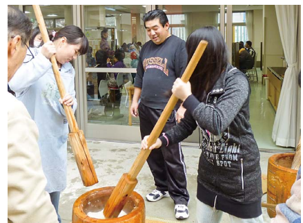
平成25年度もちつき大会 (あまぎ・うしぶせ)