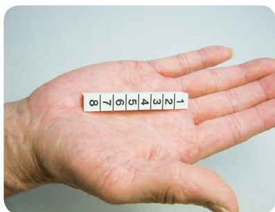
ニードルチェッカー 大きさ65mm×10mm

小さな製品なので、作業するには集中力が必要です。老眼鏡を新調した方もいます。やる気十分！