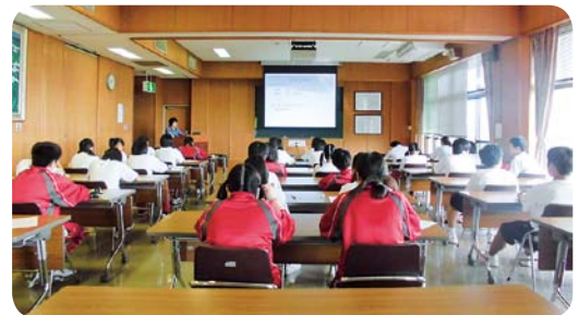
福祉についての講話

今回の福祉体験学習や文化祭のボランティア経験が、生徒さん達の中に残り、将来、さまざまな福祉の現場で活躍してくれることを期待します。