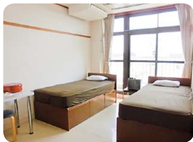
宿泊室 洋室（ツイン）