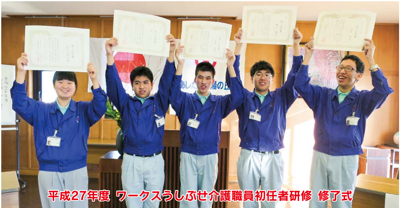
平成27年度 ワークスうしぶせ介護職員初任者研修 修了式

障害者支援施設/あまぎ学園・ワークスうしぶせ・かめぎ学園・ワークスとおがさ・静岡県立富士見学園 障害福祉サービス事業所/クリエイト太陽 共同生活援助事業/コムート浮島、フレンズ柴田・西井出・井上・岡宮・下香貴・宮本、ファミーコ西椎路・ふたせがわ・原・まつなが・さくら・なおや・宮本・原田地・片浜、サンライズ宮本・西椎路・まつなが 相談支援/総合地域サポートセンターひまわり 障害者就業・生活支援事業/障害者就業・生活支援センターひまわり 地域生活定着支援事業/静岡県地域生活定着支援センターひまわり 沼津市障害者相談支援事業/生活支援センターあしたか 公益事業/研修センター