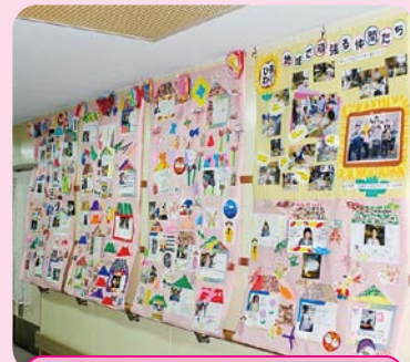
総合地域サポートセンター ひまわり