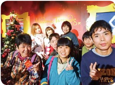
マダム・タッソーお台場