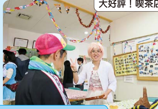
ワークスうしぶせ