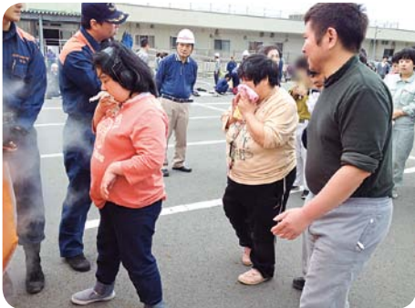
煙を吸い込まないように ハンカチを口と鼻に当てます

静岡県では、毎年11月1日を「社会福祉施設防災の日」とし、県下の社会福祉施設において一斉に防災訓練を実施しています。