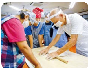
おいしいお蕎麦、できるかな？

また、ボランティアの指導による蕎麦 そば うち体験や、バリ舞 ぶら 踊 り など、様々な文化に触れる活動をたくさん企画しています！