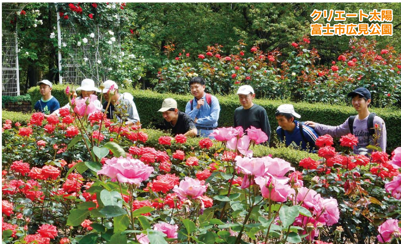
クリエート太陽 富士市広見公園

障害者支援施設/あまぎ学園・ワークスうしぶせ・かぬき学園・ワークスとおがさ・静岡県立富士見学園 障害福祉サービス事業所/クリエート太陽 共同生活援助事業/コムート浮島・西井出・井上・岡宮・下香貫・宮本・ファミリーコ西椎路・ふたせがわ・原・まつなが・さくら・なおや・宮本・原団地・片浜・サンライズ宮本・西椎路・まつなが 相談支援/総合地域サポートセンターひまわり 障害者就業・生活支援センター事業/障害者就業・生活支援センターひまわり 地域生活定着促進事業/静岡県地域生活定着支援センターひまわり 沼津市障害者相談支援事業/生活支援センターあしたか 公益事業/研修センター