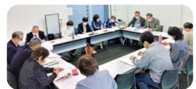
それぞれの視点から情報や意見を出します

就職した後も、継続してサポートをします。就職がゴールではなく、未来がより豊かになるよう、皆で応援していきます。