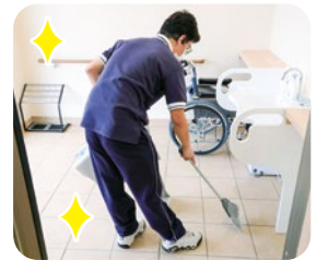
丁寧に取り組みます