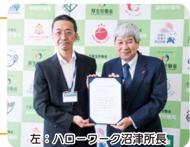
左：ハローワーク沼津所長