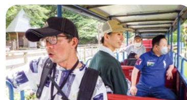
鉄道からの景色も最高です

昼食後は修善寺虹の郷へ。ロムニー鉄道に乗ったり、あじさいや花しょうぶを見たり、ソフトクリームを食べたりと、思う存分満喫しました。来年は