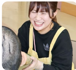
かぬき学園 まわべ 諏訪部支援員 初めての介助も笑顔で挑戦