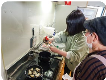
豚バラ大根にぶり大根😊

一人暮らしはまだ少し寂しいけれど、趣味を楽しむ時間もたくさん。休日には大好きな動画鑑賞をして、癒されています。