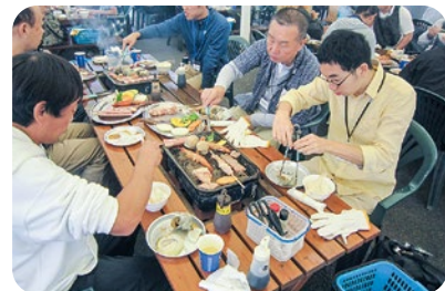
就業交流会 みんなで浜焼き♪

機関と勉強会や会議を実施したりといった取り組みも行っています。地域を主体として社会資源の幅を広げ、制度を柔軟に利用できるよ