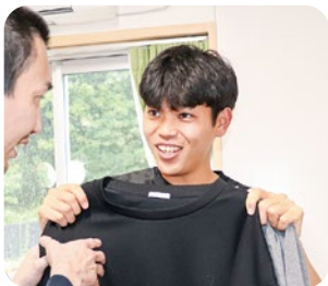
富士見学園 かわせ 川瀬支援員 利用者さんと一緒に洋服選び

令和6年4月1日、新たに11人の職員を迎えました。それぞれの配属先で奮闘中の11人をよろしくお祈りします😊