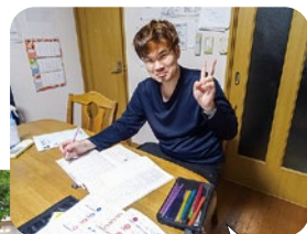
夕食後は学科の勉強

普通自動車運転免許を取ったら、「シビックに乗って愛知県や神奈川県にドライブに行きたい」「地元の墓参りに母親を車に乗せて連れて行ってあげたい」という想いを抱きながら頑張って勉強しています。大きな夢が叶うのも、もう少し。