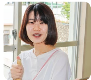
あまぎ学園 おおishi 大石支援員 作業について勉強中です