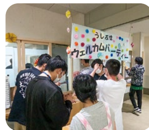
2年生が、1年生を迎えるために準備をしました

新利用者の歓迎会を行いました。プログラムを決め、自治会役員が司会進行し、会食を通して利用者同士の親交を深めました。