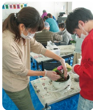
市からの受託事業 沼津市文化・趣味・教養講座

機関と勉強会や会議を実施したりといった取り組みも行っています。地域を主体として社会資源の幅を広げ、制度を柔軟に利用できるよ